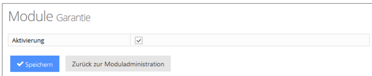
Abbildung 2: Modul Konfiguration

In der zentralen Konfigurationsmaske des Garantie-Moduls kann man angeben, ob es verwendet wird oder nicht (Aktivierung).