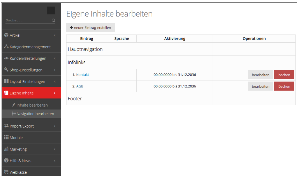
Abbildung 1: Eigene Inhalte erstellen

Klicken Sie als erstes bei „Eigene Inhalte“ auf „Navigation bearbeiten“.