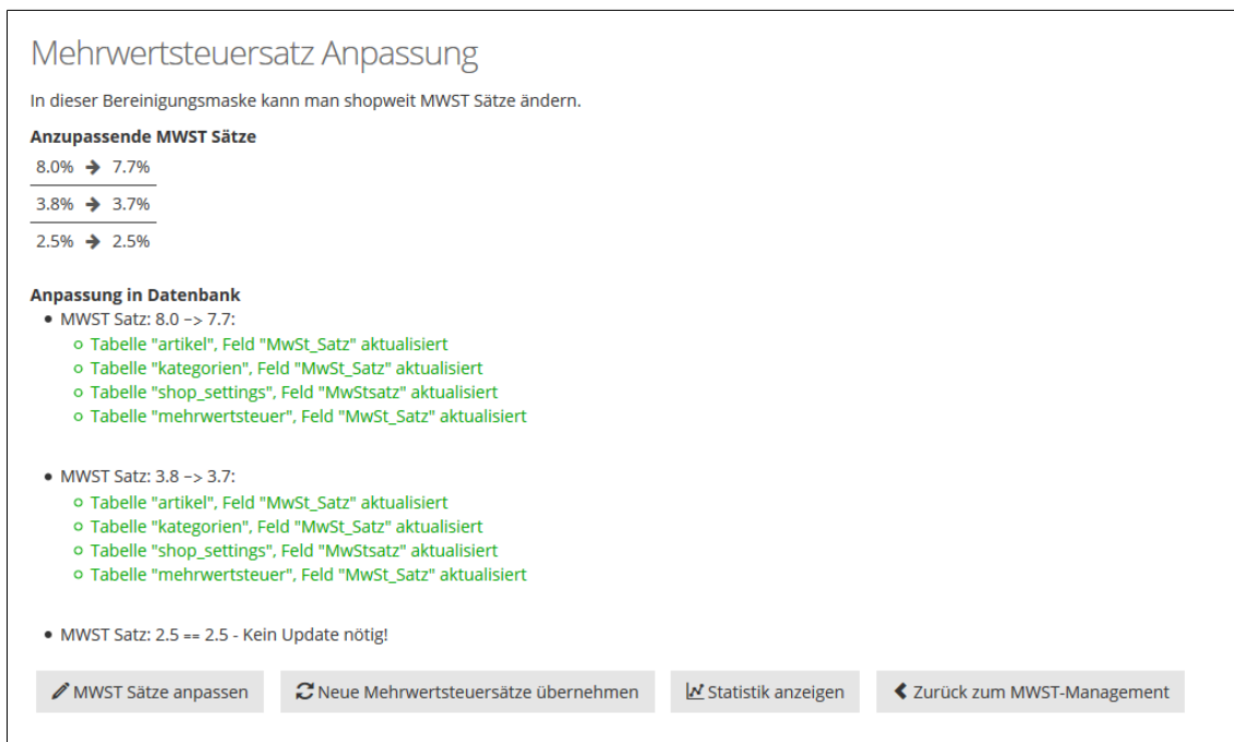
Abbildung 3: Erfolgsmeldung MWST-Anpassung

Bitte auf den Button 'Neue Mehrwertsteuersätze übernehmen' klicken. Danach folgt die Ausgabe der Erfolgsmeldung. Ab sofort gelten nun die neuen Sätze.